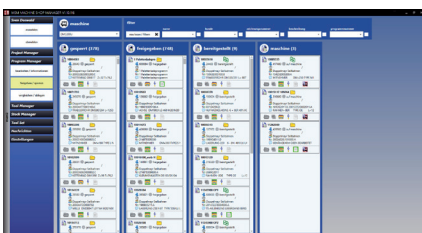
Übersichtliches Abbild der jeweiligen Programme und deren Zustand.

Ebenfalls ermöglicht cadamMSM eine schnittstellenfreie Verwaltung aller Werkzeugkomponenten und Komplettwerkzeuge in TopSolid 7 ohne zusätzlichen Aufwand. Werkzeuge und deren Einsatz- und Lagerstandort können rasch und einfach ermittelt werden. Für die Werkzeugvoreinstellung erstellt cadamMSM automatisch Differenzlisten und kommuniziert direkt mit dem Werkzeugvoreinstellgerät. Nebst all diesen umfangreichen Tools unterstützt sie cadamMSM mit einer leistungsfähigen Kunden- und Projektverwaltung. Lassen sie sich cadamMSM präsentieren und überzeugen sie sich von der Einfachheit!